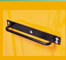
• Χειρολαβή ανάρτησης* * Κατόπιν ζήτησεως