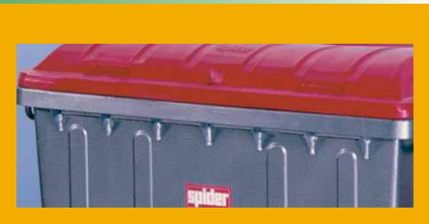
• Ανάρτηση τύπου κτένας